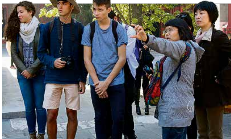
En octobre 2014, quatre Montreusiens ont été accueillis à Xicheng. Commune Montreux