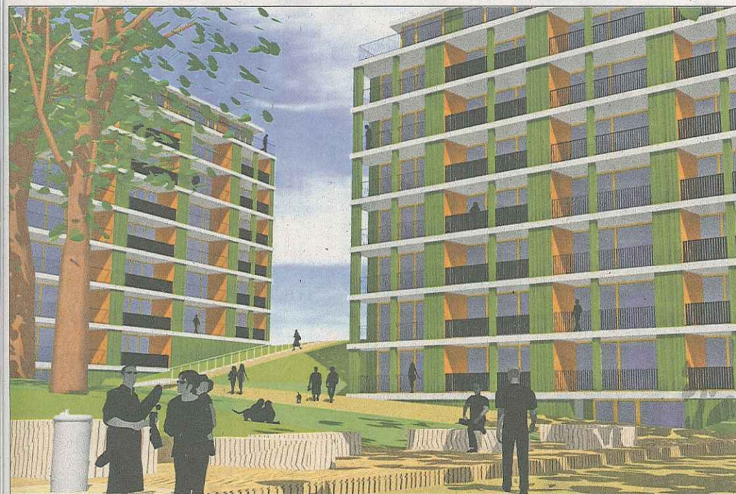
Image de synthèse des deux immeubles de logements sociaux. Celui de gauche est déjà en construction. Ils abriteront une majorité de quatre et cinq-pièces. (DR)